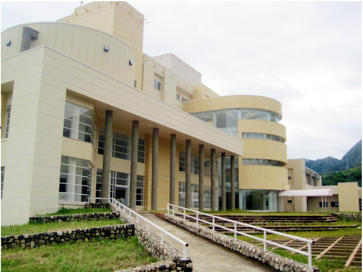
HOSPITAL DE YOPAL ESE CASNARE, 2013